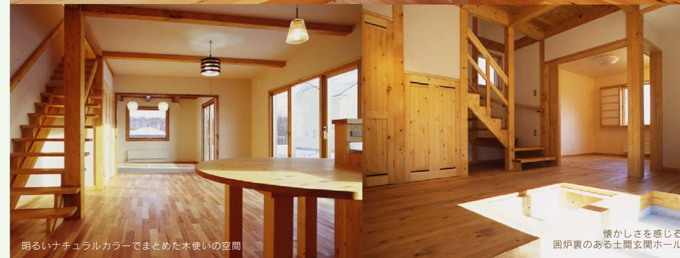
明るいナチュラルカラーでまとめた木使いの空間