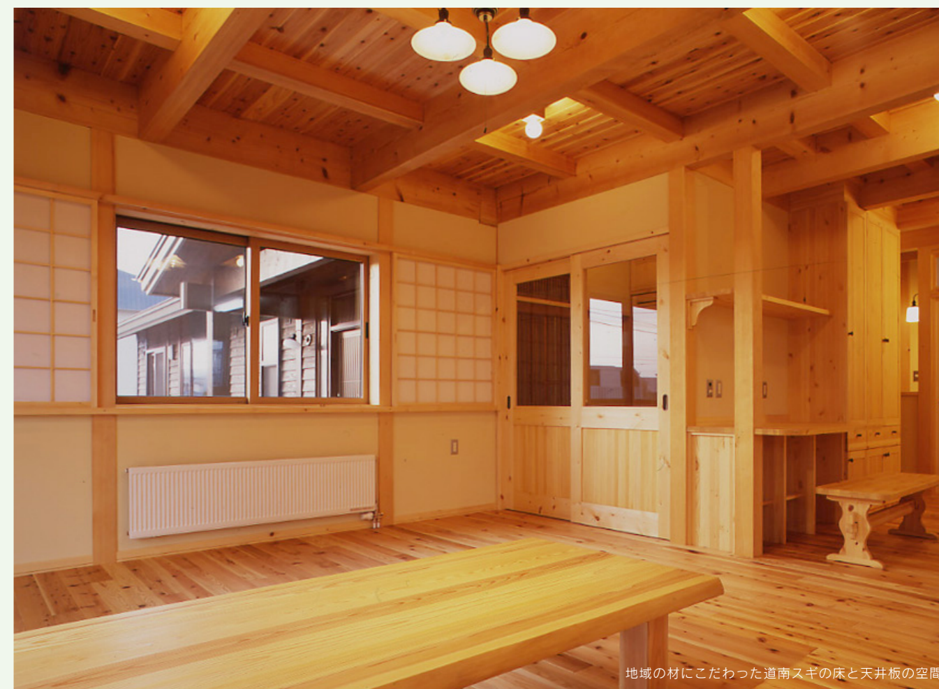
地域の材にこだわった道南スギの床と天井板の空間