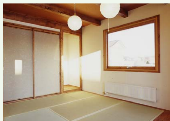
梁を現しながらもシンプルにまとまった和室

が、白身のトドマツで組んだ木組みの家を見ると、北海道独特の雰囲気を感じるらしいよ。 それにしても最近は、接着剤で形成した木材の柱や梁で建てる家が増えてきている。家に使われる化学物質、接着剤の総量もうなぎのぼりだ。だからこそ僕は、逆に無垢の木へのこだわりが年々強くなる。 50年後の家が、ただのゴミになる