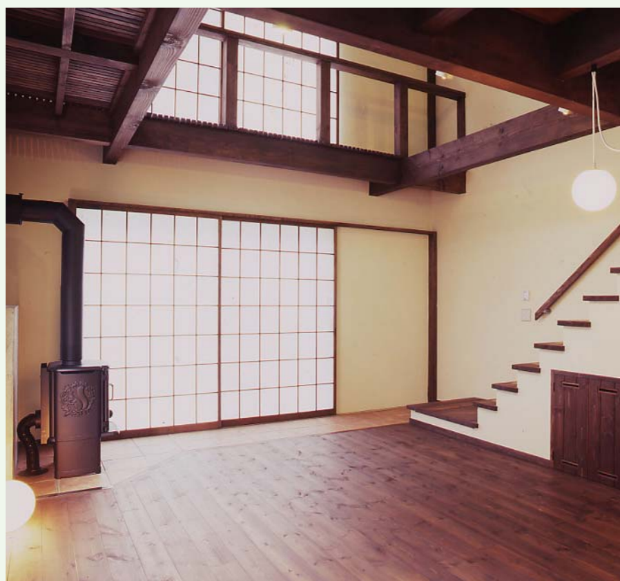
古色仕上げでくつと落ちついた雰囲気の内装になる

いと思うけれど、無垢の木を集めて太い大黒柱を大胆に使う。当然梁も太くなる。デザインによって和風にも洋風にも変化するように、どこか懐かしさや心がホッとすると、木組みでシンプルな空間をつくりたいと思っている。 北海道の木や土などの自然素材を使う。魚の好みじゃないけど、赤身の多いスギを多用する本州の人