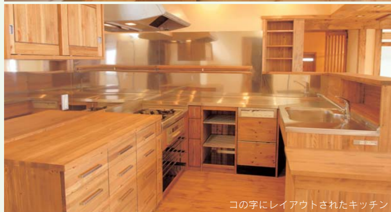
コの字にレイアウトされたキッチン