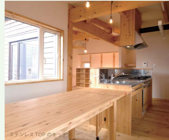
ステンレス TOP のキッチン

を使うと良い。ワークトップの素材はステンレス、人工大理石、タイルなど選択肢はあると思うけれど、もし天板も無垢の木にしたい場合は植物油のオイル塗料を十分に染み込ませ、撥水性の高いカルナバロウワックスなどを時々塗ってあげると良い。理想は輸入木材を使わずに、北海道産のカラマツ・トドマツ・ナラ・タモなどの無垢材を使う。目指すところは、健康と環境にも負荷の少ない「北海道の木キッチン」をリーズナブルな価格で提供することなのだ。