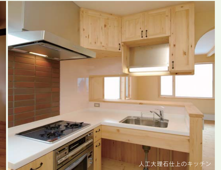
人工大理石仕上のキッチン

エコすたとは エコロジー、エコノミー、スタンダード、ライフスタイルなどを合わせて僕たちがつくった造語です。 健康な住まいは安全な食品と変わらないと言うコンセプトのもと、エコハウスづくりのための自然建材を扱うエコショップの店名にもなっているのです。