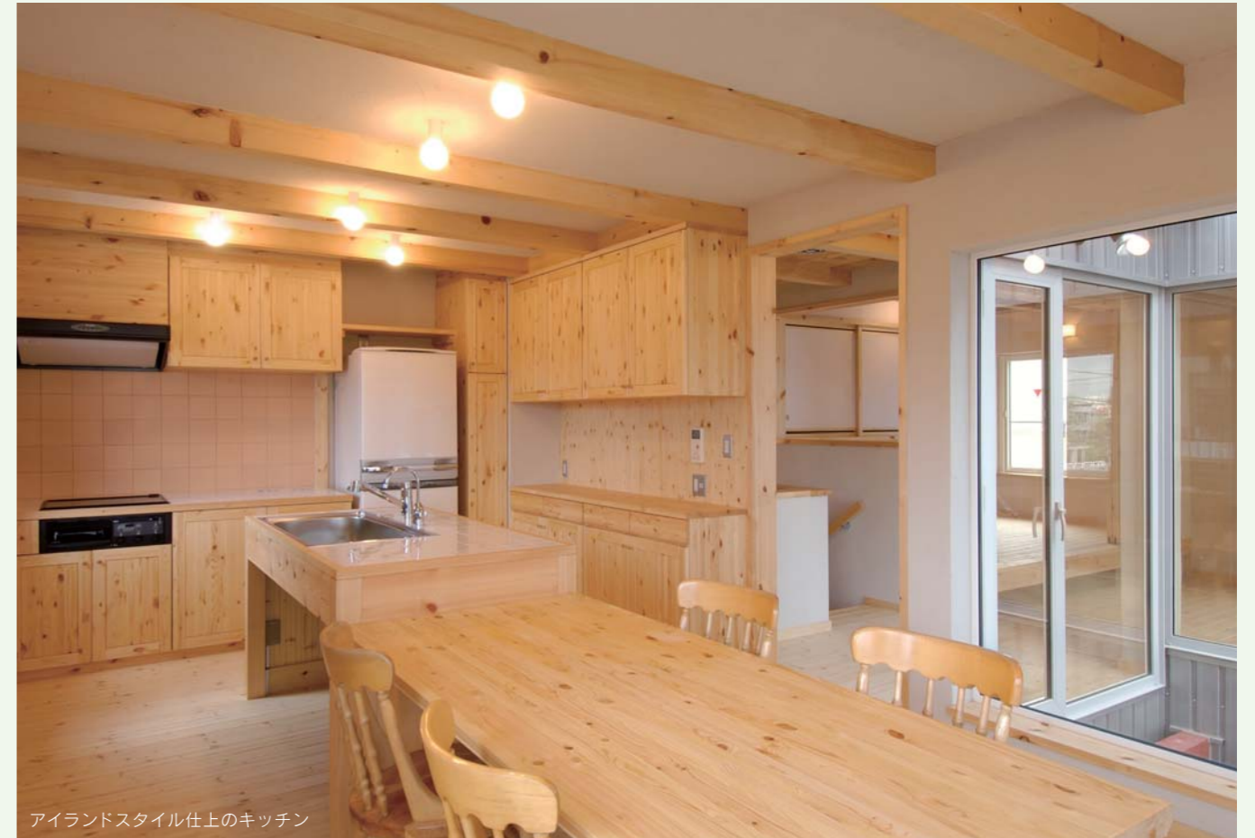
アイランドスタイル仕上のキッチン