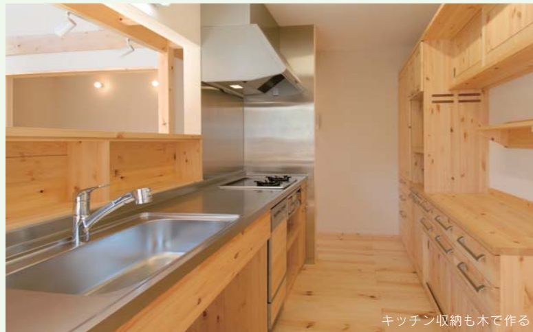
キッチン収納も木で作る