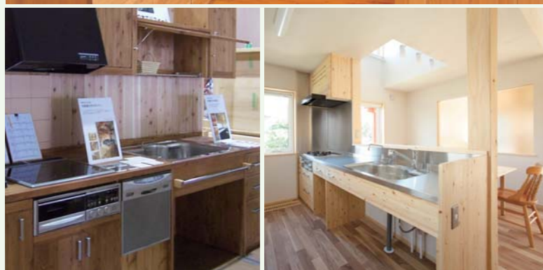
道産カラマツのキッチン